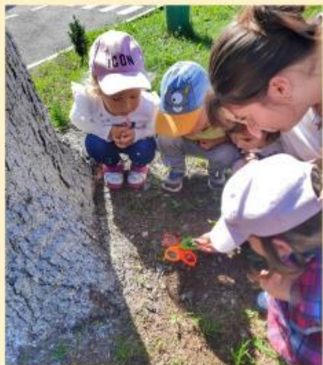
Спостереження за комахами